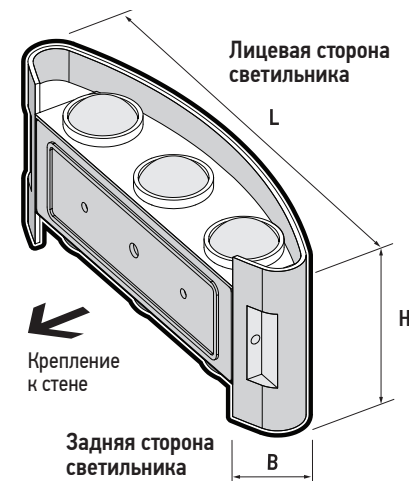
Рис.1 Схема установки светильника PWL-80160 6W

Технические характеристики определённого артикула Изделия указаны на упаковке. Фирма производитель оставляет за собой право на внесение изменений в конструкцию, дизайн и комплектацию Изделия, не ухудшающих его технических и потребительских характеристик.