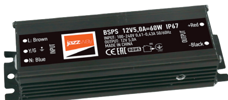
BSPS 12V5,0A=60w IP67