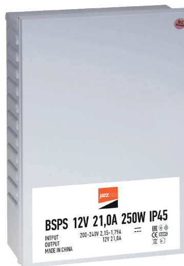
BSPS 12V21,0A=250w IP45

Блоки питания BSPS 12V jazzway предназначены для отдельного питания светодиодной ленты в системах внутреннего и внешнего освещения.