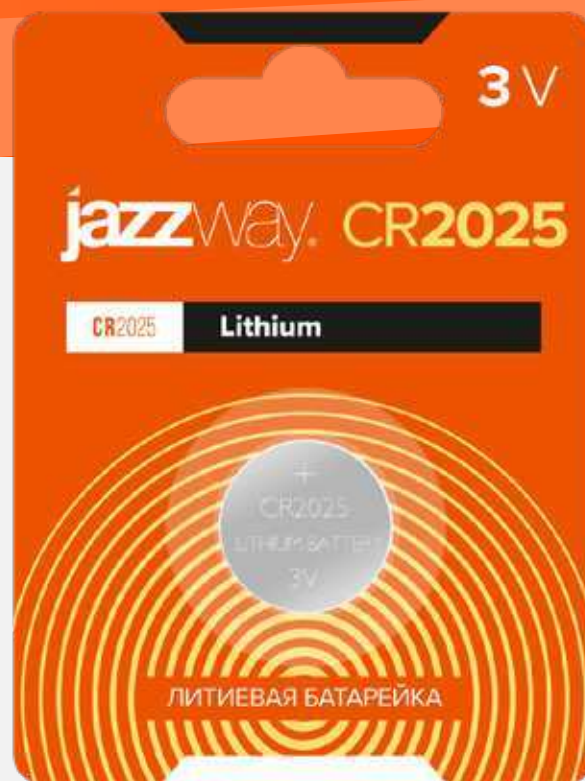
CR2025-1B Код: 2852861