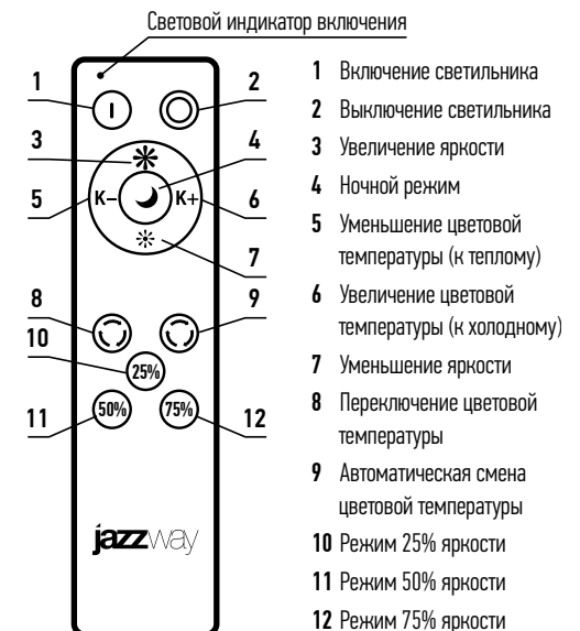
Пульт дистанционного управления (ДУ)