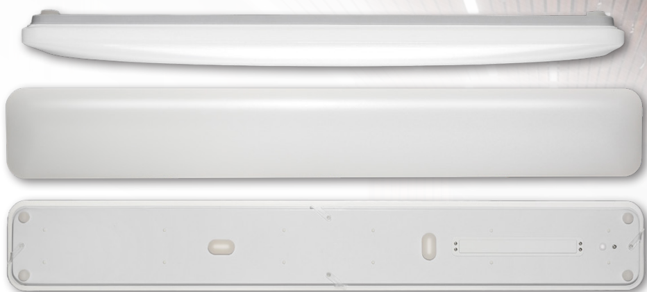
PPO-06 1200 OPAL 50w PRO-5